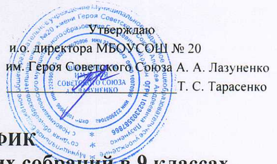
ГРАФИК проведения родительских собраний в 9 классах в МБОУСОШ № 20 им. Героя Советского Союза А. А. Лазуненко с. Новомихайловского по вопросам подготовки к ГИА-2021